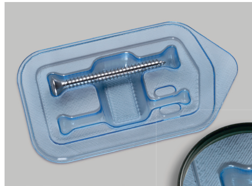
Blister mit Rapid-Prototyping Lieferzeit: 2 – 3 Tage

Die Kosten für die Herstellung von solchen Prototypen sind durch die heutige moderne Technik auch bezahlbar. Fragen Sie uns bitte für ein unverbindliches Angebot an.